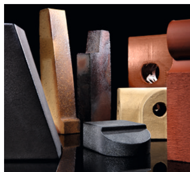
▲ Verschiedene Typen